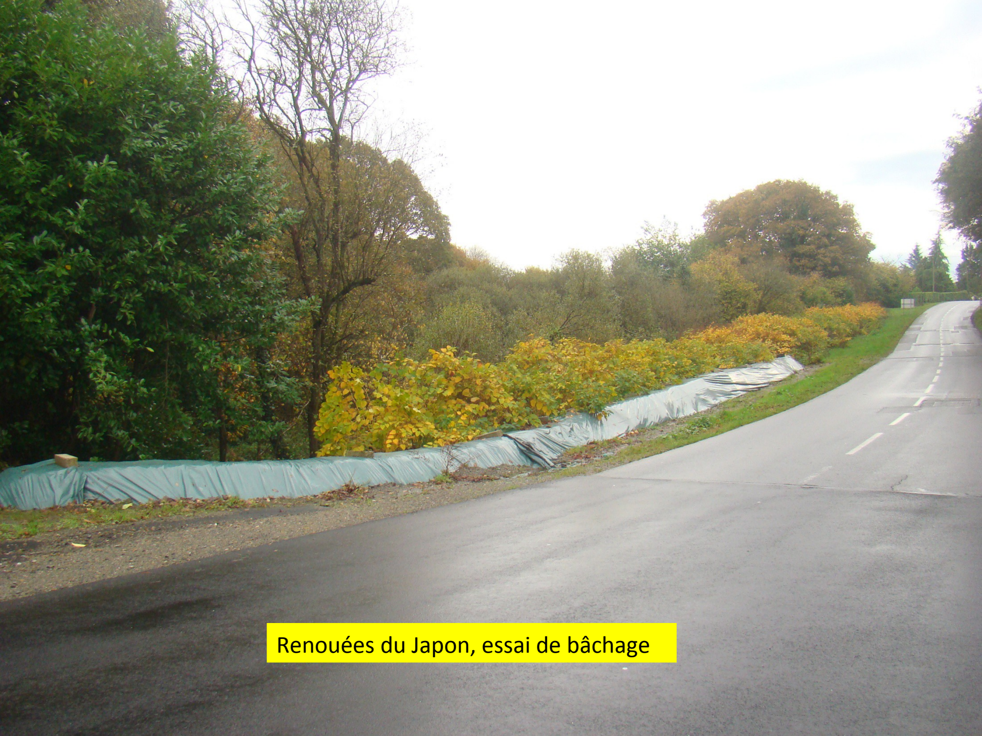
Renouées du Japon, essai de bâchage